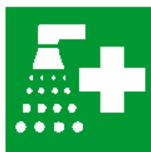
DOCCIA di EMERGENZA