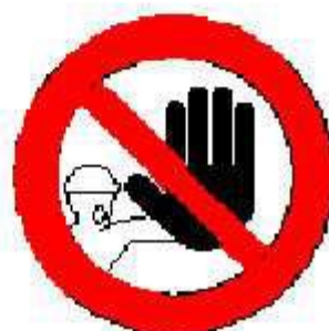
Divieto di accesso alle persone non autorizzate