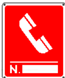
Telefono interventi antincendio