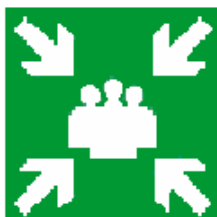
PUNTO DI RACCOLTA