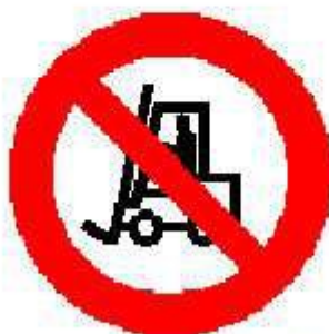
Vietato ai carrelli di movimentazione