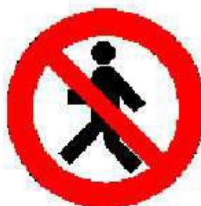
Vietato ai pedoni