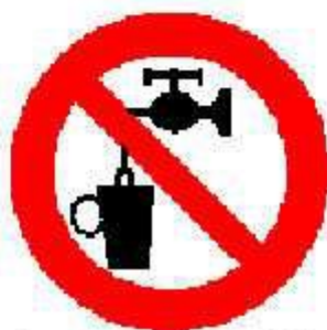
Acqua non potabile