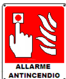
Pulsante allarme incendio