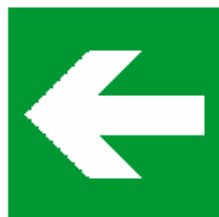
DIREZIONE DA SEGUIRE

Cartello da aggiungere a quelli di percorso