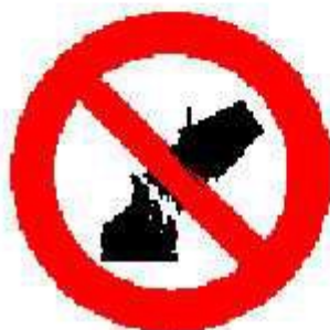
Divieto di spegnere con acqua