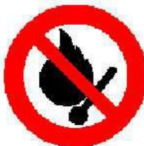
Vietato fumare o usare fiamme libere